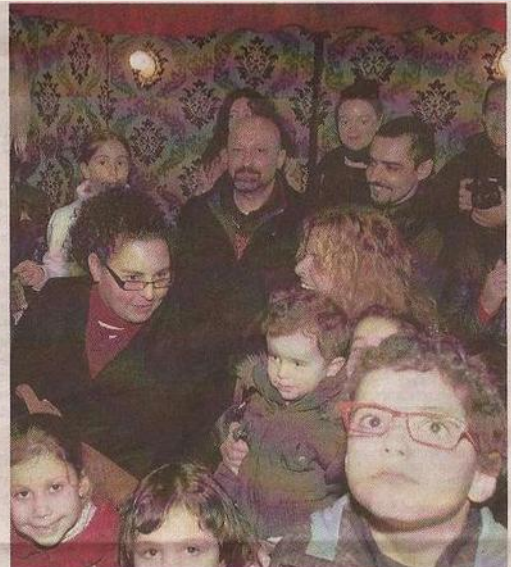
Público en el teatrillo de Ymedioteatro. :: SEVILLA